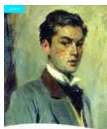
The Picture of Dorian Gray